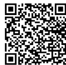
영사콜센터 무료전화앱 (Android)